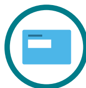
Aangifte inkomsten- belasting

413 inwoners van de gemeente Stadskanaal deden al mee. Gemiddeld bespaarden zij € 518 per jaar.